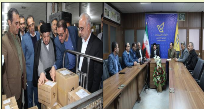
بازدید رئیس کل دادگستری و دادستان مرکزی استان فارس از واحد واحد توزیع امانات و مرکز تجزیه و مبادلات اداره کل پست استان فارس