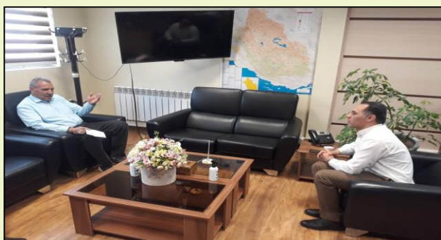
ملاقات با ارباب رجوع و پیگیری تقاضای برقراری ارتباط در حوزه عشایری