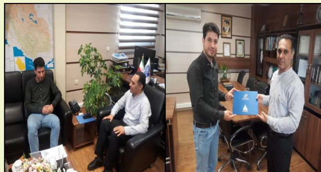
اعطای مجوز افتا به شرکت جهان اطلاعات ایمن سرو